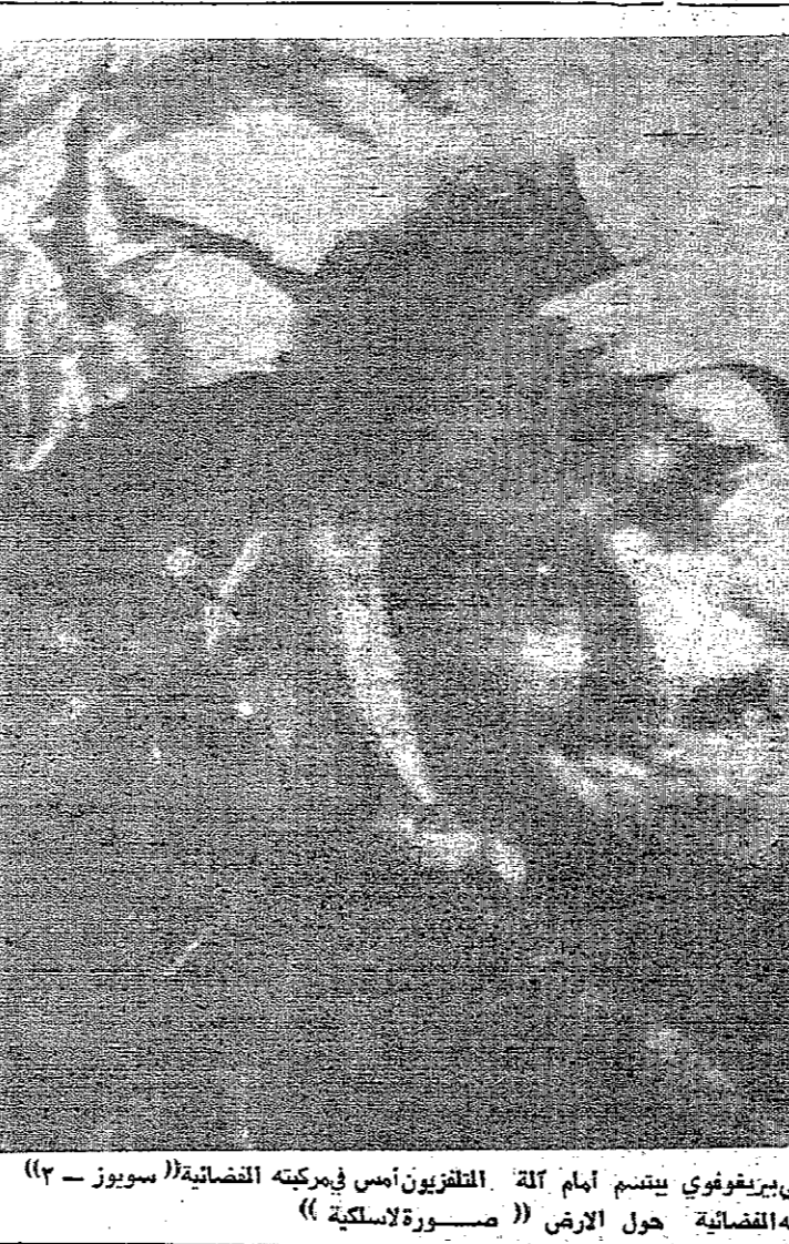
رائد الفضاء السوفياتي جورجى بيرغوفو يمشي امام آلة التلفزيون امس في مركبه الفضائية «سويوز - ٢» وهو يعني اليوم الرابع من رحلته الفضائية حول الارض «صورة لاسلكية»

الرباط - رويتر - ذكرت وكالة صحافة المغرب العربي امس ان فتاة من هانا بالبحرة منذ يومين بسبب اشغالات شديدة بالروسية ضمم على اجزئهم في الساعات الاولى من بعد الظهر . اجتماع - بقية الدكتور بارينغ من منضمه كسفر لها لدى الاتحاد السوفياتي هي اقصر اجازة تمنحها له خلال فترة كونه يجهته التي بدأت قبل سنة واحدة . وكان قد أعلن يوم السبت الماضي ان هذه المهمة قد تمت شهرا واحدا يبدأ في اول تشرين الثاني القادم ، وكانت الامم المتحدة قد نفت في السابق ان تكون مهمة الدكتور بارينغ محددة بالنسبة الى الوقت . تفقد الامير حسن - بقية امس زيارة مدينة اربد حيث اجتمع الى السيد عبد الحميد الجالي محافظ اربد ومدير شرطة المحافظة وكبار المسؤولين الاداريين . وقد اطمأن سموه على سير العمل في المحافظة وعلى احوال المواطنين فيها .